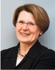
Cornelia Rogall-Grothe, Staatssekretärin im Bundesministerium des Innern, Beauftragte der Bundesregierung für Informationstechnik

Bei der Umsetzung des E-Governments gilt es, aktuelle technische und gesellschaftliche Entwicklungen aufzugreifen, um damit die IT der Verwaltung effektiv, effizient, sicher und zukunftsfähig aufzustellen und gleichzeitig Beständigkeit und Kontinuität im Handeln zu gewährleisten.